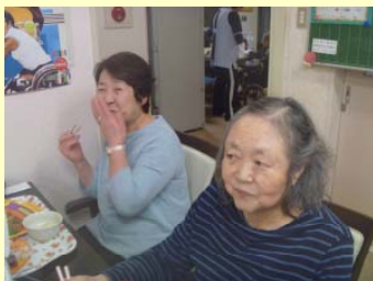
写すのちょっとまって!