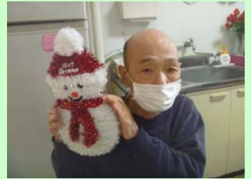
だるまも俺もかわいいべ!