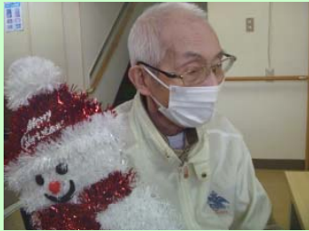
もう、なんでもやるじゃ!