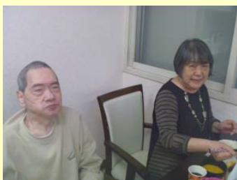
今、ピリピリしてない?