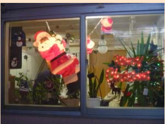
サンタもツリーも来てまった。