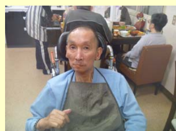
今日も食べるぞ。肉くれ!