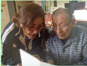
見える? ごだよ ご!