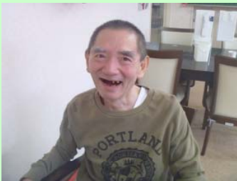
歩けるようになってきた!