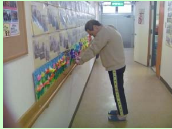
今、ビリビリ来てる!