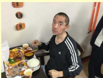
一杯食べて歩くぞ!