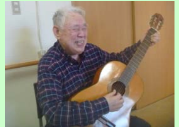
Tさんちょっと待った~! 俺もプロ裸足だぜ!