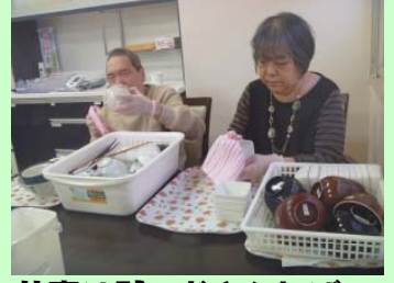
仕事は黙々とやんねばの!