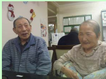
なんだがさ楽しい!