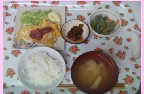
豚肉のピカタ定食