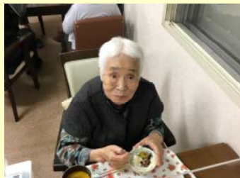
カワイイ行事食だの!